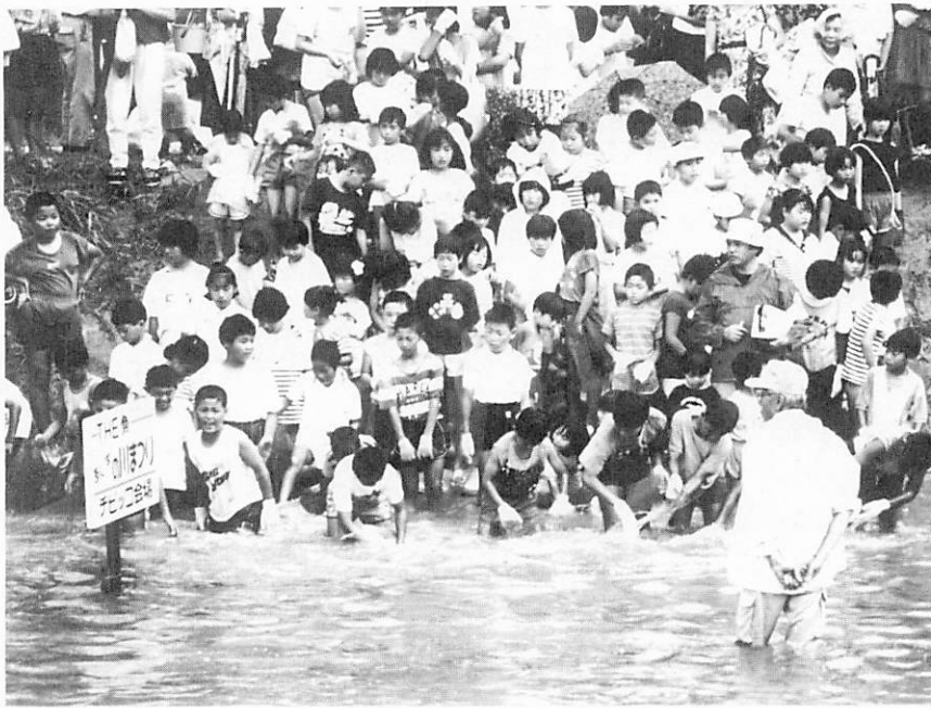
スタートのラッパの合図と同時に 「ヤッター たくさんとるぞ」

ことしの「あじすの川まつり」は七月二十五日に阿知須小学校そばの井関川で催されました。