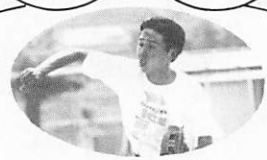
阿知須の 巨人の星