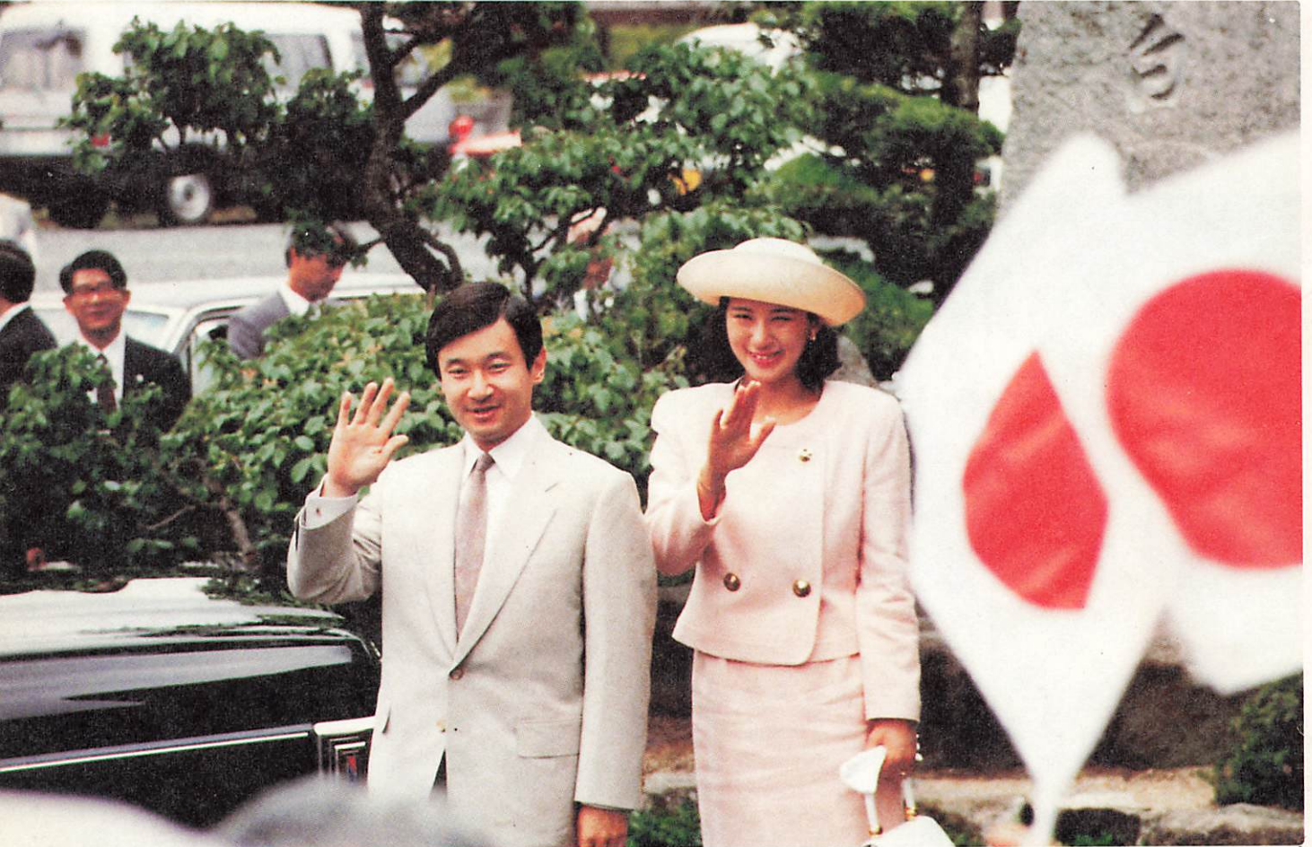
▲たくさんの人たちの出迎えに笑顔でこたえられる皇太子ご夫妻