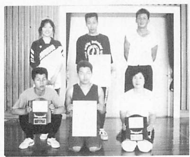
混合の部優勝 虚無僧チーム