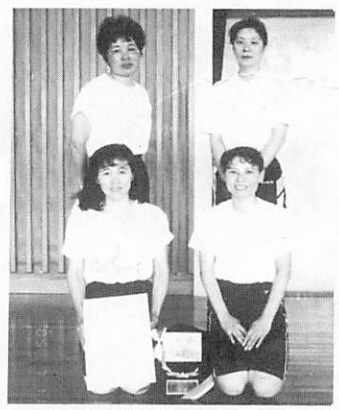
インディアカ大会優勝 砂郷チーム

人づくりはまちづくり。第二次基本構想を背景に、平成三年七月町長から生涯学習審議会に対し、「阿知須町における生涯学習まちづくりの推進について」の諮問があり、審議会は、平成四年十一月、「生涯学習まちづくりの課題と、その充実、振興策」を中心に答申がなされました。