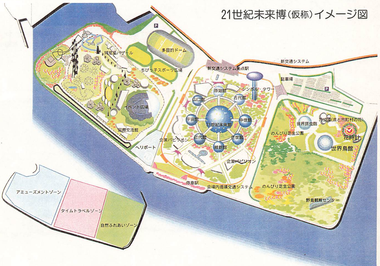
21世紀未来博(仮称)イメージ図