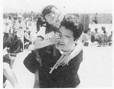
お父さんの 背中でバクツッ!