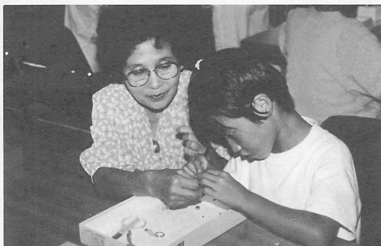
おばあちゃんの優しさが手から伝わってきます