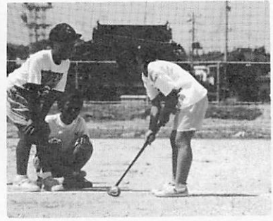
子ども会 球技大会 三世代ゲートボール