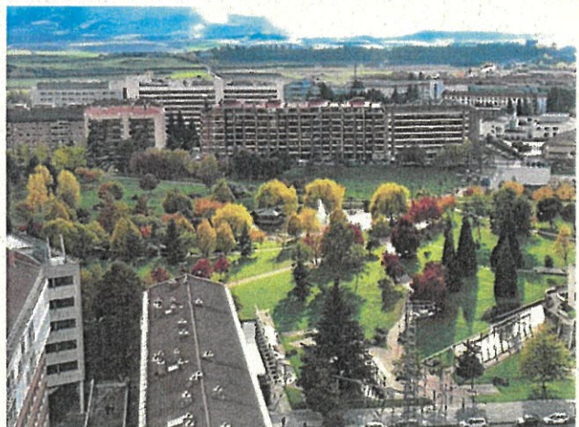
自然豊かなパンプローナ市街地の様子