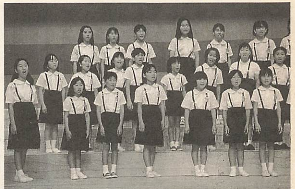
△みんなで奏でる美しいハーモニー 6月13日、市民会館大ホールで「山口市小・中学校合同音楽祭」が開かれました。小学校3校、中学校9校、約500人の生徒が出演、合唱や吹奏楽などで美しいハーモニーを奏で、日頃の練習の成果を出しました。