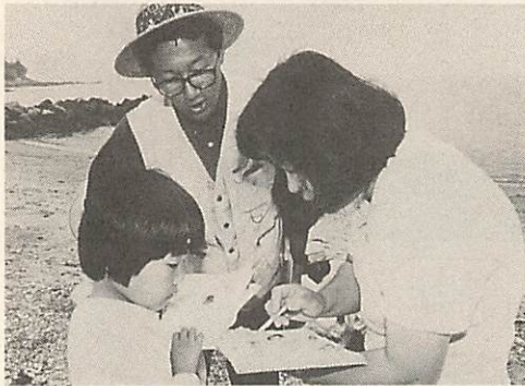
△海辺の生き物を観察

6月14日、秋穂二島・美濃ヶ浜で「海辺の生き物と親しむ会」が開かれ、市内の小学生の親子約30人が参加、貝を採集し、観察するなかで、自然に対する関心を深めました。