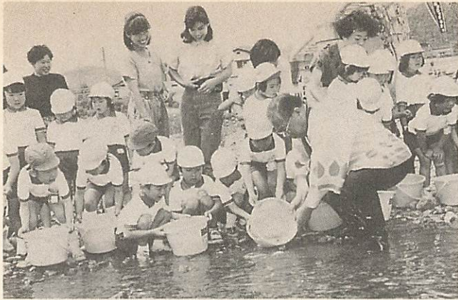
△仁保川に園児がコイを放流 6月6日、水道週間行事の一環として、大内幼稚園や東山保育園など五つの幼稚園・保育園の園児約2百人が、佐内市長とともに、水道局横の仁保川に千五百匹のコイを放流しました。