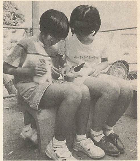
△子供たち、ウサギの飼育にがんばる 大殿小学校では、5・6年生の飼育委員会や飼育当番によって、25羽のウサギを飼育しています。そのうちの12羽は、6月7日に生まれました。子供たちは、毎朝、八百屋で野菜くずをもらってきて、ウサギに食べさせています。