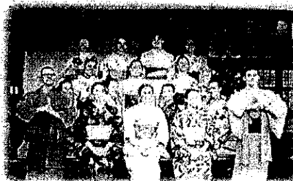
日本文化体験(茶香亭)