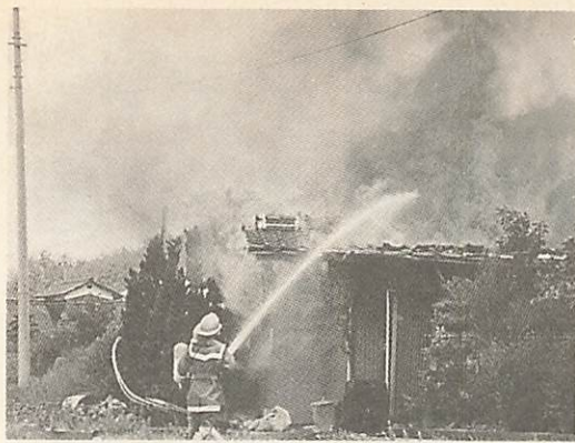
表1 市内の火災発生状況 (単位:件)