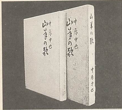
＜中也の処女詩集「山羊の歌」