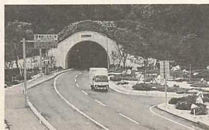
鳳凰山トンネルと道路公園

この工区の開通により、旧道に比べ、距離で1・6km、時間で約十一分短縮されます。