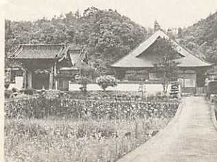
緑に囲まれた玄答院

市文化財審議会(白杵華臣会長)が、6月10日開かれ、玄答院(仁保下郷)の「木造二天立像(二軀)」を市指定有形文化財として指定するよう答申し、このほど正式に指定されました。 木造二天立像は、阿形(あぎょう) 高さ一六九センチ、咩形(うんぎょう) 高さ一七三・三センチ、ほぼ等身大です。 いずれもヒノキの一木造り、彫眼・頭・体の主要部分は、堅くなった一材から彫られています。 手、足は、阿形の右腕が肩と手首で継いであり、この右腕は、後で補修したものです。左腕は、一材から彫られ、肩で継がれています。 藤原時代(一一〇〇年前