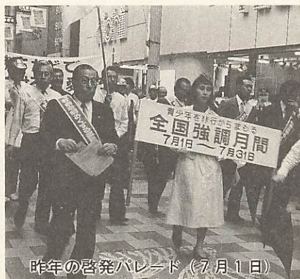
昨年の啓発パレード(7月1日)

地域では ・ 定期的、継続的にお互いの悩みや問題を話し合い、解決方法を考え合う組織づくりをする。