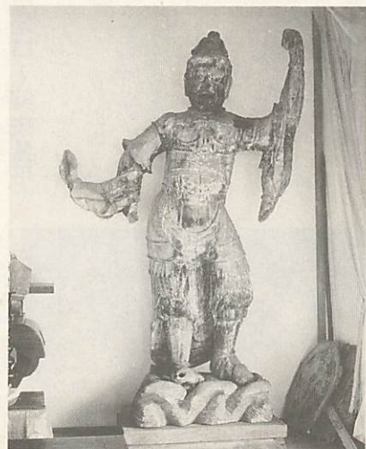
「木造二天立像」の阿形像

市文化財審議会(白杵華臣会長)が、6月10日開かれ、玄答院(仁保下郷)の「木造二天立像(二軀)」を市指定有形文化財として指定するよう答申し、このほど正式に指定されました。 木造二天立像は、阿形(あぎょう) 高さ一六九センチ、咩形(うんぎょう) 高さ一七三・三センチ、ほぼ等身大です。 いずれもヒノキの一木造り、彫眼・頭・体の主要部分は、堅くなった一材から彫られています。 手、足は、阿形の右腕が肩と手首で継いであり、この右腕は、後で補修したものです。左腕は、一材から彫られ、肩で継がれています。 藤原時代(一一〇〇年前