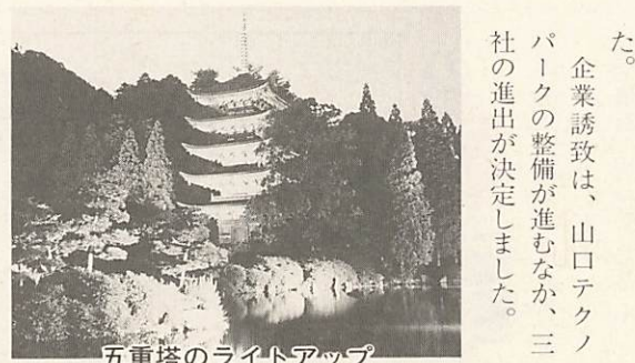
五重塔のライトアップ

農業関係では、仁保・佐山地区で、ほ場整備事業を推進するとともに、陶・鑄銭司地区などで、ため池改良事業を行いました。その他、水田農業確立対策事業（生産性の向上）、園芸振興事業などを実施しました。