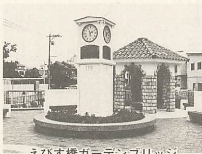
えびす橋ガーデンブリッジ

をはじめ、街路事業では、東山通り下矢原線、糸米羽坂線、黄金町野田線などの改良を行い、公園整備事業では、藤尾山公園、高田公園、河原児童公園などの整備を行いました。公共下水道事業では、富田原町、鰐石町、白石三丁目、大歳地区の一部など処理区域面積を六八ヘクタール広げ、平成四年度末の処理区域面積は、六七七ヘクタールになりました。また、仁保下郷における農業集落排水事業を開始し、管路施設等の建設に着手しました。住宅の整備では、折本住宅の建て替え、市営住宅の改修を行いました。消防施設の整備では、宮野、名田島、秋穂二島に防火水槽