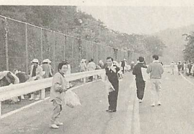
昨年の「空き缶ゼロの日」

昨年11月、市内16地区の代表などで構成する市健康と環境を守る会を中心に小さな親切運動山口支部、地元嘉川地区の皆さん、市職員など300人が「空き缶ゼロの日」と銘打って、このパーキングエリアでごみの収集を実施。ごみを投げ捨てないように呼びかけました。その日1日だけで集められたごみの量は2トトラック2台分にもおよびました。また、この日集められたごみの中にはふとんや生ごみ、ごみ袋にまとめて入れられている空き缶など家庭などから排出されたごみもあり、想像