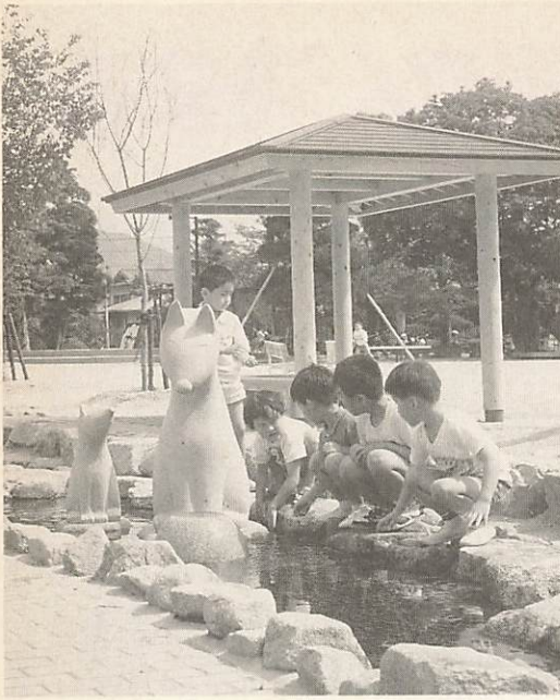
平成4年度特別会計決算見込み等は、次のとおりです。