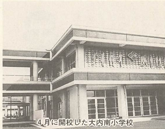
4月に開校した大内南小学校

築をはじめ、湯田小、良城小、陶小、湯上中の校舎等を増築したほか、大殿中、湯田中、大内中、湯上中に情報教育施設（パソコン等）を整備しました。