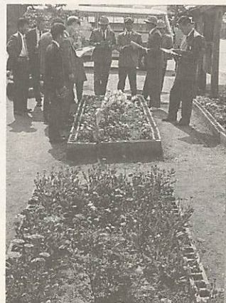
△第1回花壇コンクールの審査風景(昭和38年)

山口市の花いっぱい運動は、昭和三十八年の山口国体を機に大きく盛り上がりました。また、この年から始まった花壇コンクールは、今年でちょうど三十周年。長い年月を経て地域に根ざした花いっぱい運動の輪は今、なお一層の広がりを見せています。