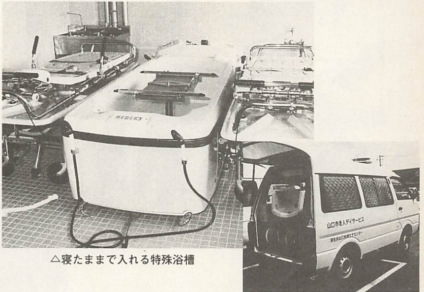
△寝たままで入れる特殊浴槽