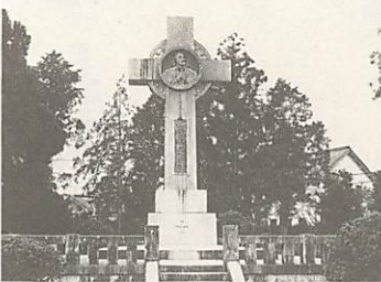
サビエル公園(金古曾)の記念碑

サビエルが義隆に献上した西洋楽器については、「十三ノ琴ノ緒(糸)ヲヒカザルニ五調子ヤ十二調子ヲ吟ズル大内義隆記」とあり、オルガン、オルゴール、音楽時計、手風琴など諸説がありますが、いずれにしても日本で初めてここ山口の地で西洋楽器の音色が聞かれたのではないのでしょうか。