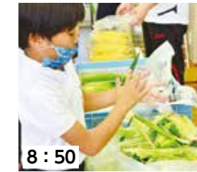
8:50 皮の片づけもしっかりと。「食べるための準備は大変」