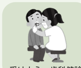
受けよう、歯科健診

診療時間内に受診しましょう。【救急医療電話相談の利用】救急車を呼ぶべきか悩んだ時、また、深夜に受診できる医療機関については、救急医療電話相談#7119 また