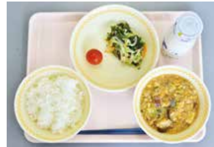
秋穂小学校（秋穂学校給食センター）

市内・県内産の食材をおいしく食べることは、食材や地域に親しみを感じ、郷土を愛する心を育むことにもつながります。各学校では、給食時間中の校内放送で、その日の献立に使用されている食材について紹介し、食への関心を高める取り組みも行っています。市内・県内産の食材を使った、各学校の献立をご紹介します。