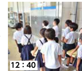
12:40 食器を返却。「おいしかった。ごちそうさまでした！」

自分の口にするものが、自分の住んでいる地域で採れた農産物だと知るとは喜びにつながります。地域で採れた野菜に実際に触れて、命の恵みや食に関わる人への感謝の気持ちを育んで欲しいと思います。