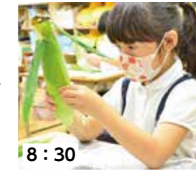
8:30 皮むき開始。「初めて。スパーで見る姿と違うね」