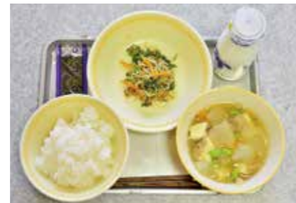
仁保小学校（仁保学校給食共同調理場）