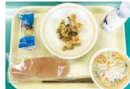
徳佐小学校（阿東東学校給食共同調理場）