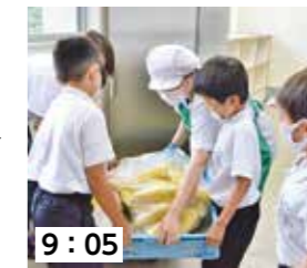
9:05 協力してとうもろこしを調理場まで運びます。