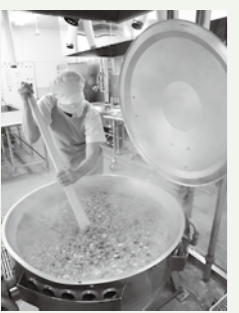
全身を使って大鍋の中をかき混ぜる給食調理員。おいしい学校給食に欠かせない縁の下の力持ち。

徹底された調理場の衛生管理に、「好き嫌いをなく食べよう、頑張れあ」と声掛けを繰り返す先生。私が小学生だった当時、何気なく食べていた給食は、一人ひとりが生涯健康で過ごせるようにという、多くの方の思いが込められたものだったのだと感じると同時に、日々の食事に丁寧に向き合うことの大切さを改めて実感しました。