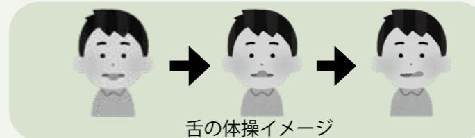
舌の体操イメージ

口を開けて、舌を思いっきり出したり引っ込めたり、左右や上下に動かしたりしてみましょう。