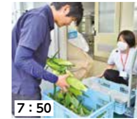
7:50 JA山口南営農センターからとうもろこしが到着。

名田島小学校では、校内の畑で野菜を育てたり、給食に使用される野菜の下処理を行ったりする活動を通して、食育の推進に取り組んでいます。この日は、JA山口南営農センターから納品された名田島産のとうもろこし「みらい」を、1・2年生が皮むきしたのち、名田島共同調理場で蒸して、名田島小学校を含む近隣4校の給食で提供されました。