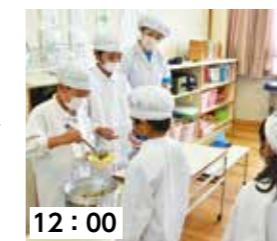
12:00 配膳。静かに、丁寧にみんなの机まで運びます。