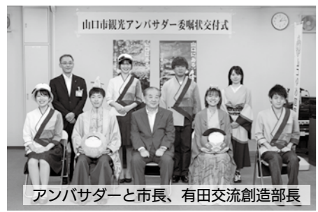
アンバサダーと市長、有田交流創造部長

山口市観光アンバサダーは、山口大学経済学部観光政策学科の協力のもと、毎年委嘱しており、卒業するまでの間、観光について学が大学生の視点を通して、本市をPRしていただいています。このたびは7人に委嘱したことから、山口市観光アンバサダーは計18人(4年生5人、3年生6人、2年生7人)となりました。