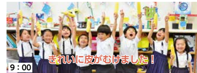
9:00 全てのとうもろこしの皮むきが終了。「皮むき楽しかった！もうおいしそう」今日の給食は、いつも増して楽しみな様子。