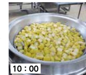
10:00 390人分のとうもろこしを回転釜で蒸します。