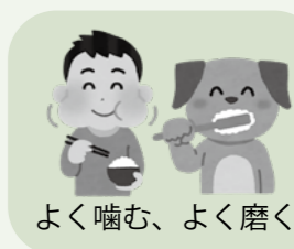
よく噛む、よく磨く