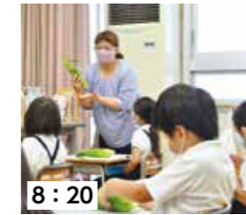
8:20 先生から皮むきの手順について説明を受けます。