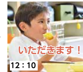
12:10 いただきます！「今まで食べたとうもろこしの中で一番甘い！」