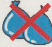
（色のついた肥料袋）