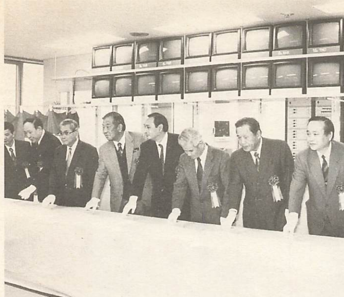
ケーブルテレビの試験放送開始（昨年10月）