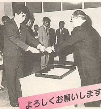
よろしく願います

新規採用 新しく市で採用された職員は、市長事務部局三九人、教育委員会八人、中部環境施設組合一人、消防組合六人の計五十四人です。四月一日、辞令の交付をうけました。