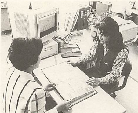
4月1日から業務開始した生涯学習相談所

また、今後、山口市内の情報について、より内容を充実させるため、学習機会や団体・サークル、講師・指導者情報、催し物情報など各種情報の募集も行っています。