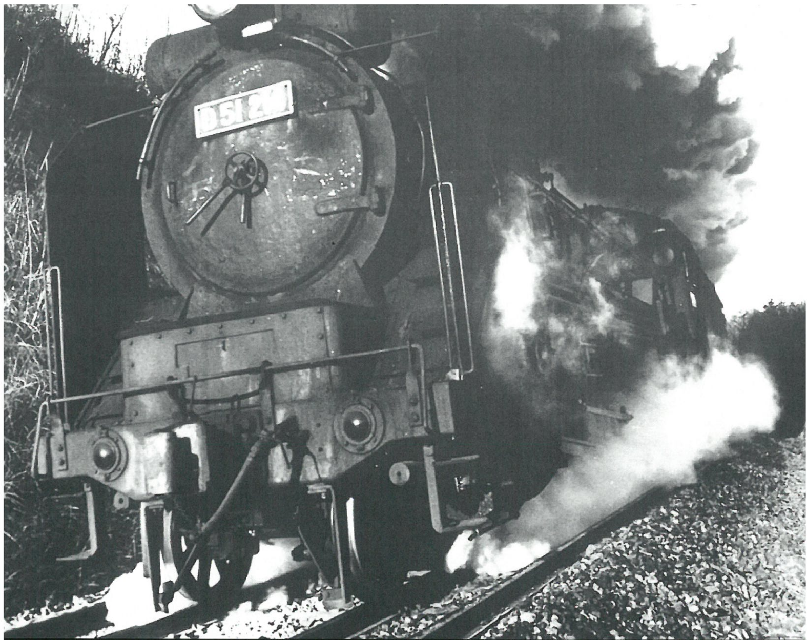
蒸気機関車 D51 型 (昭和 48 年)