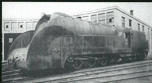
蒸気機関車 C55 型 流線型 (昭和 13 年)