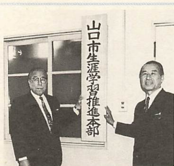
山口市生涯学習推進本部

四月四日、生涯学習に関する施策を総合的に推進するために、佐内市長をはじめ計二十人で構成する市生涯学習推進本部を設置しました。 本部の事務局は生涯学習課内にあり、現在、市民からの生涯学習に関する相談等を受けつけています。 同本部の設置で生涯学習の推進に、より拍車がかかりました。