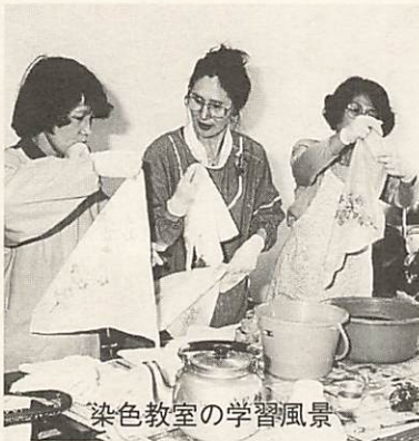
染色教室の学習風景

この構想は、学習の支援、体制の整備、人づくりから街づくりを基本的な考え方とし、家庭・学校・社会の中で生涯各期に見合った学習について、環境の整備、機会の拡充、情報提供・相談活動の充実、指導者の育成を課題として推進するものです。