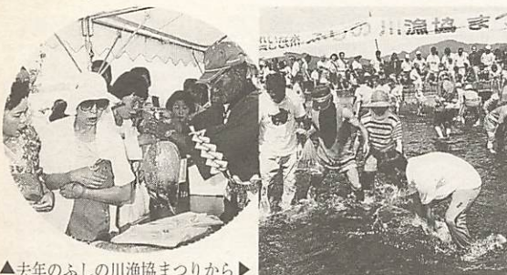
▲去年のふしの川漁協まつりから