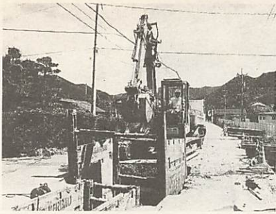
下水道の開削工事（平川で）