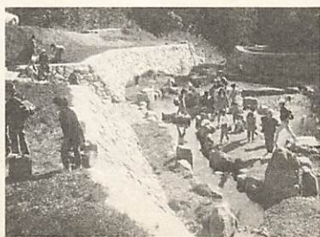
去年のミステリーハイキング

昨年は百名近い参加があり、年齢や体力に応じて三コースに分かれ、兄弟(おとどい)山へ登りました。三つのコースが合流する地点の広場には、あたたかい豚汁が用意され、昼食は持参のおにぎり片手に大満足!登山途中の紅葉や、一緒に登ったおじいちゃんの昔話など、目も耳もすっかり離せない魅力いっぱいの日でした。