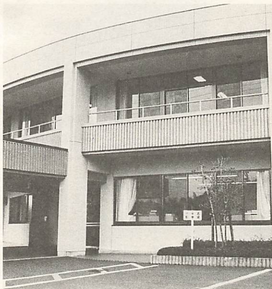
在宅介護支援センターが開設される温泉ホーム日吉台

市内で五番目の在宅介護支援センターが、陶にある特別養護老人ホーム温泉ホーム日吉台に、十一月一日オープンします。 在宅介護支援センターは、在宅で、お年寄りの介護を行っている家族の方々が、気軽に専門家に相談でき、市の窓口（高齢障害課）にわざわざこられなくても必要なデイサービス、ホームヘルプサービス、ショートステイなどが受けられるよう調整を行うところです。