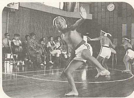
児童によるソーラン節

両校の児童代表は、それぞれに学校や地域のことを紹介し、楽しみにしていましたとあいさつをしました。 みんなの感想は、「驚きまくった」「夢のようでした」「僕らと同じ年齢なのにスゴイ