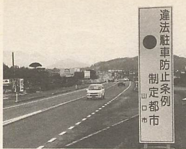
違法駐車防止条例 制定都市 山口市

昨年一年間の市内の交通事故状況は、発生件数が七百二十五件（前年六百六十一件）、亡くなられた方が十四人（同十四人）、負傷者七百九十三人（同七百六十一人）と、発生件数、負傷者とも増えています。これを原因別に見ますと、幹線道路上での車両相互、人対車両、自転車対車両など出会い頭の衝突によるもの、ま