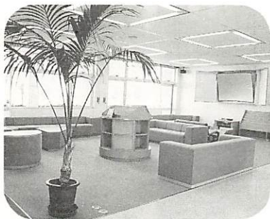
「みんなの情報コーナー」

の声が反映されています。みんながつくった公民館をみんなが使う。きつと、実り多い活動が展開されることでしょう。