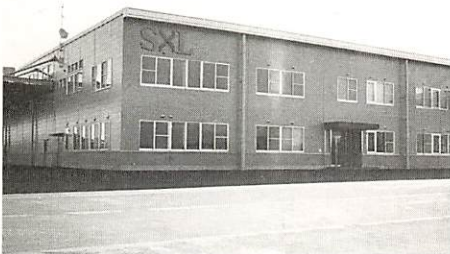
完成した（株）エス・バイ・エル山口工場

同工場は平成2年に進出決定、昨年7月から建設が進められていたもの。敷地面積は、5万9,709㎡、建物は鉄骨造り平屋建て一部2階建て2万610㎡。総事業費は35億円。山口工場では住宅用のパネル、住宅用構造部品部材の生産販売や研究開発などが行われます。従業員は70人、当初の年間生産額は33億6,000万円、最終的には89億6,000万円を見込んでいます。