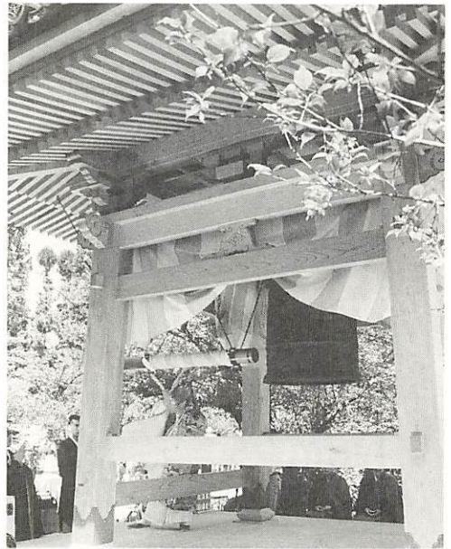
林住職によるつき初め

大殿大路の龍福寺に、新しい梵鐘と鐘楼堂が完成、四月二十六日、落成・つき初め法要が営まれました。