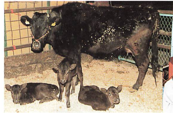
生まれたころの3つ子

昨年三月、この牧場に三つ子の仔牛が生まれました。牛は双子で生まれてくることもまれで、三つ子が生まれてくるのは、十年か二十年に一回ぐらいという非常に珍しいことだそうです。