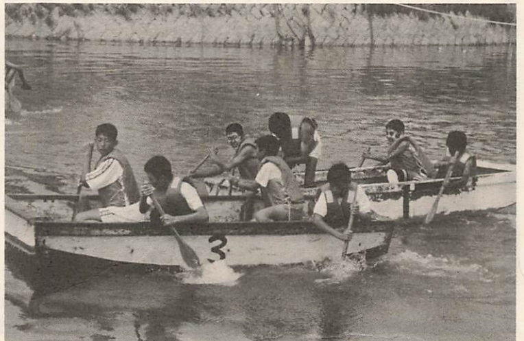
今年の「方舟競漕」には小、中学生の部を新たに設定。

毎年恒例の「あじすの川まつり」が七月三十日、阿知須小学校そばの井関川で開かれました。当日には、猛暑にもかかわらず約二十人の集客がありました。午前中に行われた方舟競漕には合計二十六チームが、午後からの魚のつかみどりには六百人が参加し、たいへん賑わいました。