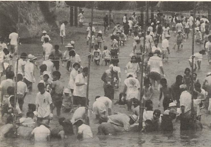
子どもも大人も大漁めざして奮闘中！