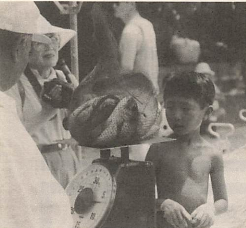
あっ、6.8キロもある…。いっぱいにとって賞かも…。