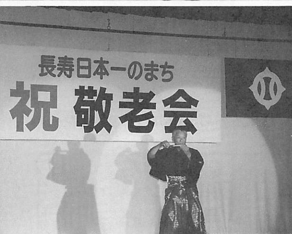
飯田町長の日舞“黒田節”