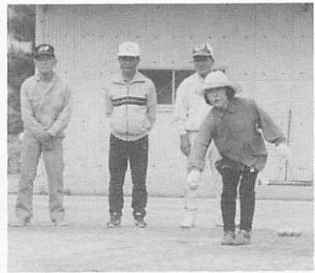
高齢者へタンク教室