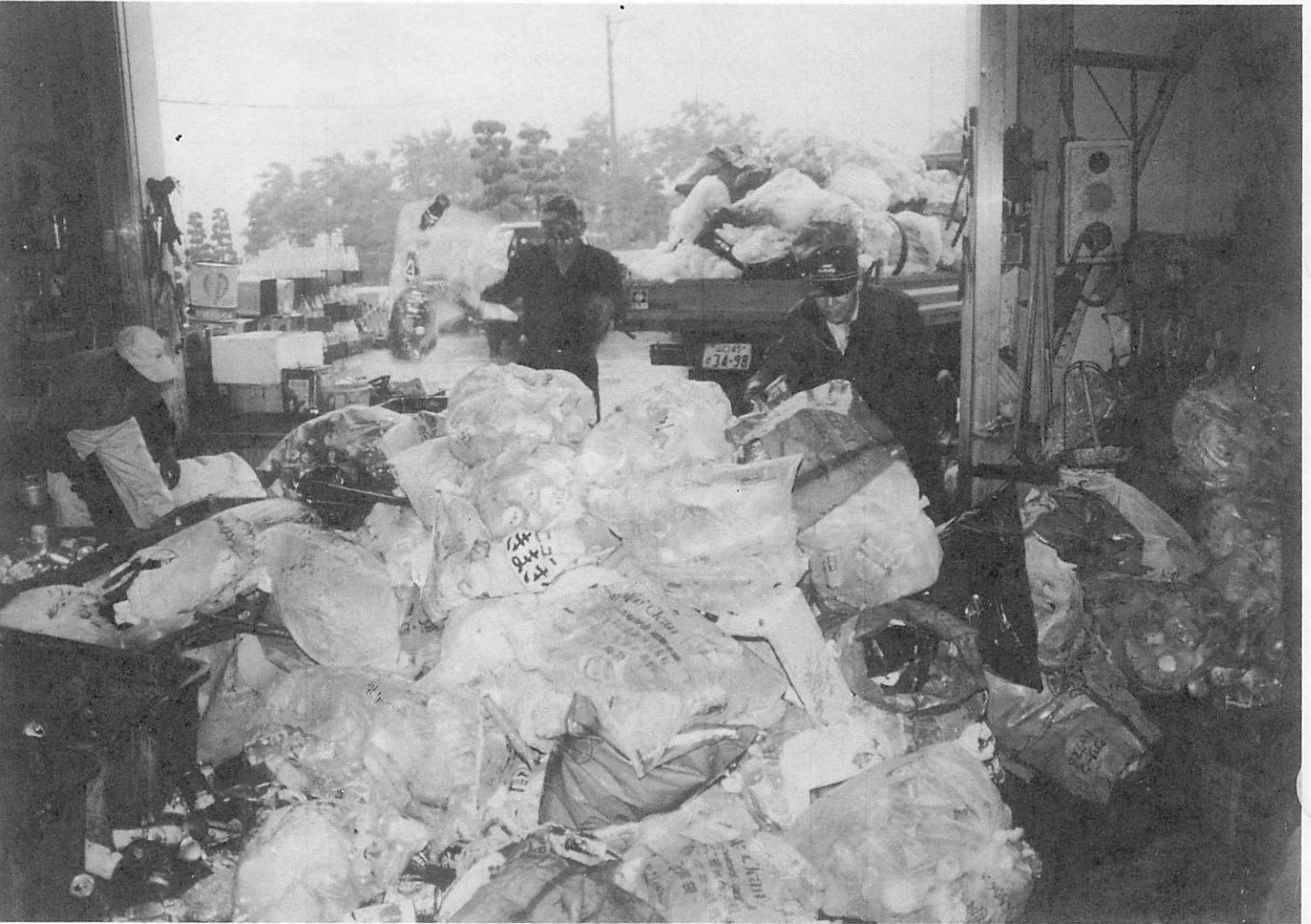
各集積場所から集められた「ごみ・缶」の山。これからひとつずつ分別れさます。(町清掃センター)