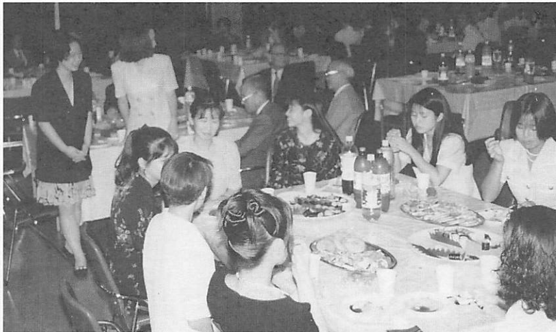
パーティーでは、久しぶりの友だちとの再会にたいへん盛り上がりました。

本町の七年度の成人式が八十五日、町公民館で行われました。対象者は男子七十一人、女子七十人の計百四十一人で、うち男女各五十五人が出席しました。