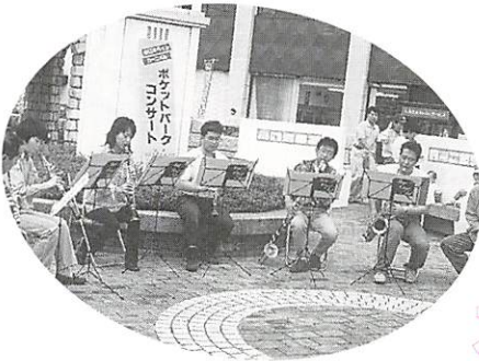
▲スペースパンプローナでミニコンサート