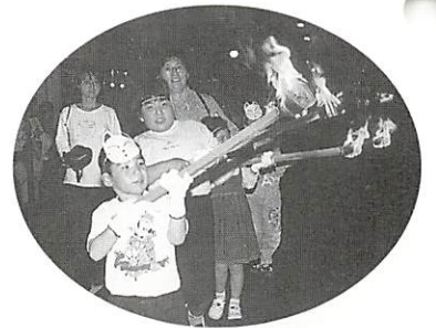
▲ 白狐のたいまつ行列