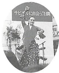
▲本場のフラメンコを満喫