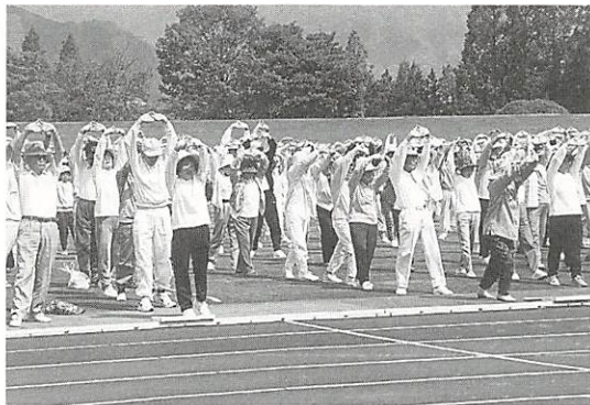
高齢者の健康増進と社会参加の促進を目的に行われた健康増進福祉体育大会

「自然と文化をはぐくみ躍動する中核都市 やまぐち」を基本理念に、平成元年に策定した、現在の「第四次山口市総合計画」