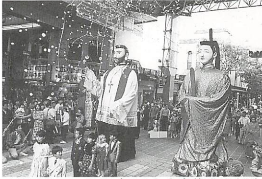
▲高さ約4mのサビエルと大内義隆の人形

平成三年に焼失、再建が待ち望まれていたサビエル記念聖堂。このたびデザインを一新した新聖堂が完成、四月二十九日の竣工式に合わせ、山口スペインカーニバルなど多彩なイベントが市内で開催されました。