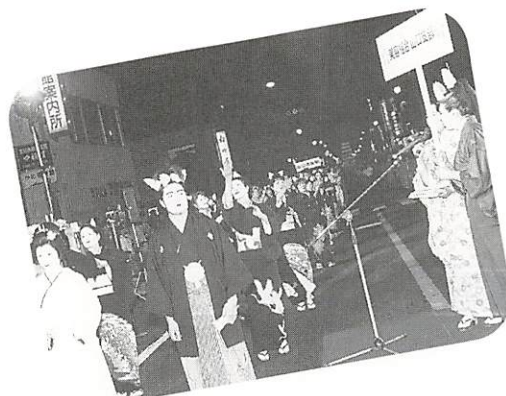
▲ 総踊りで大賞に輝いた美容組合山口支部の皆さん