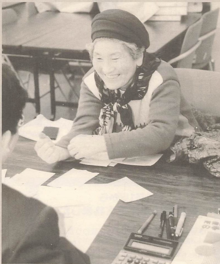
「申告」が済んでひと安心——