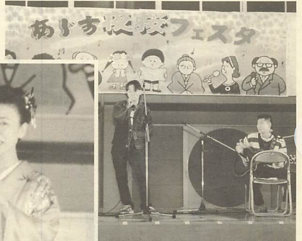
↑雨の中のバンド演奏