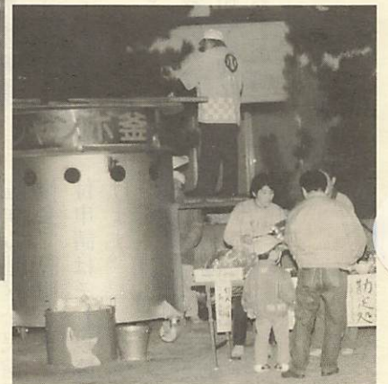
↓ジャンボあじ鍋も大盛況