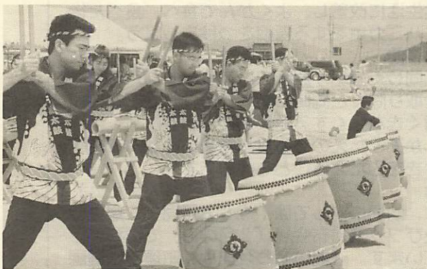
↑周防千鳥太鼓も応援