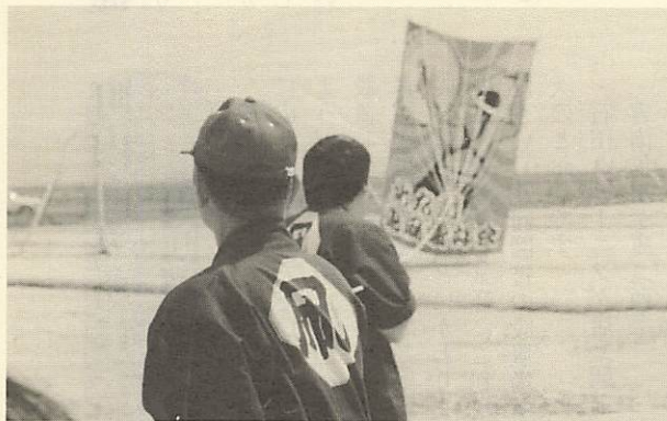
↑日本の風の会によるアトラクション