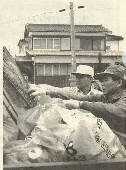
↑「よいしょこ」とごみの積み込み

毎年恒例となっているクリーンアップ大作戦が、7月7日(日)町内各地区一斉に展開されました。