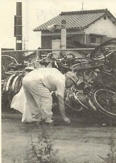
↑こんな所にもごみが…