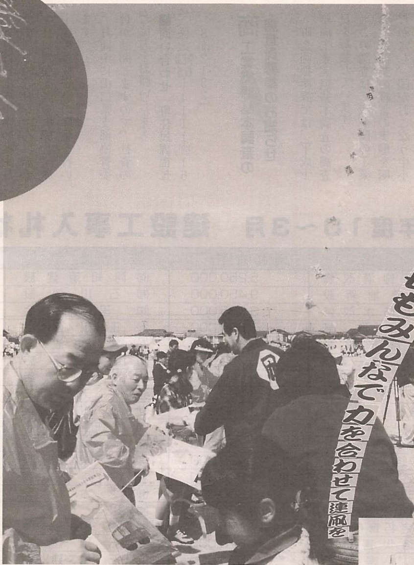
→二井知事(左)も一緒に