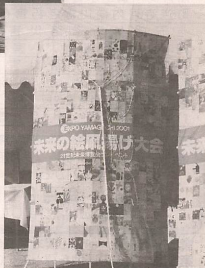
▲縮小コピーして大風に

未来の絵風揚げ大会(山口県、21世紀未来博覧会協会主催)が四月五日に干拓グラウンドで開かれました。 当日は、県内外から寄せられた未来の絵三千二百三十九枚を図柄にした色とりどりの風が青空いっぱいに舞い揚げました。その風は、日本の風の会を事前に開催年の二〇〇一年にちなんで二千一枚で連風七つ、残りの絵を使って大風五つを作成。