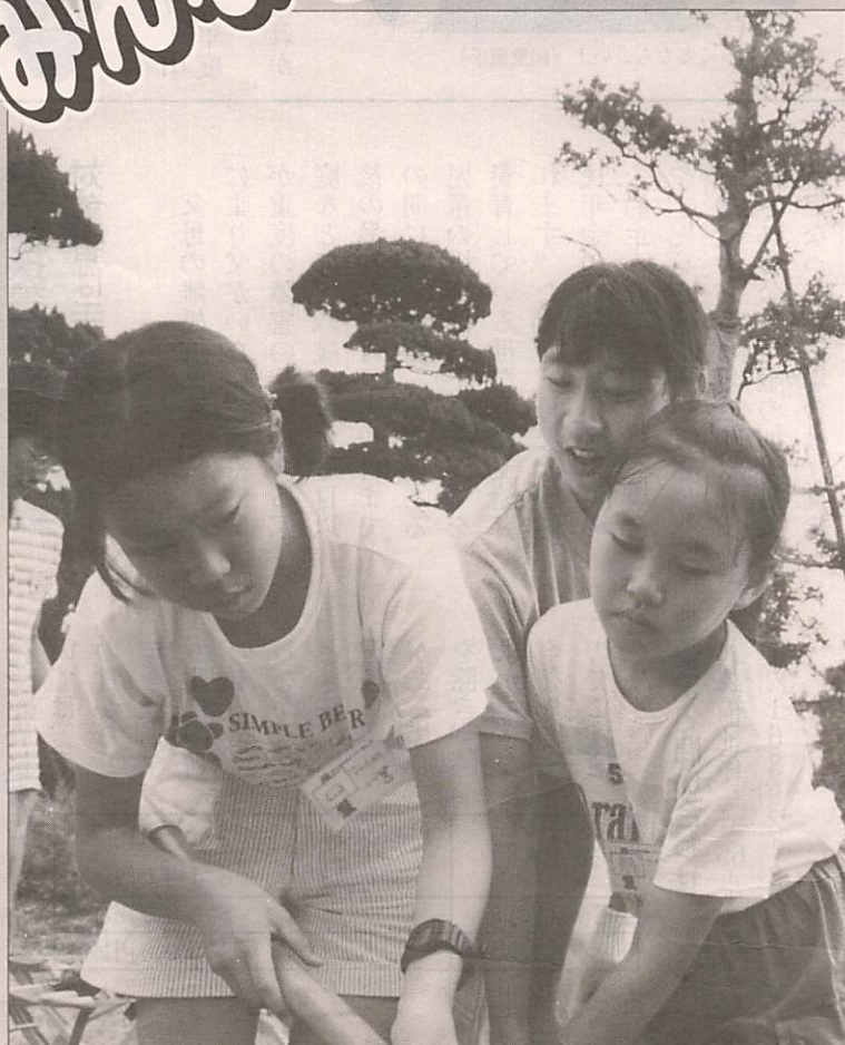
▶焦げないようにゆっくりと