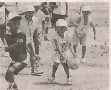
▲残念! もう少しでとれたのに