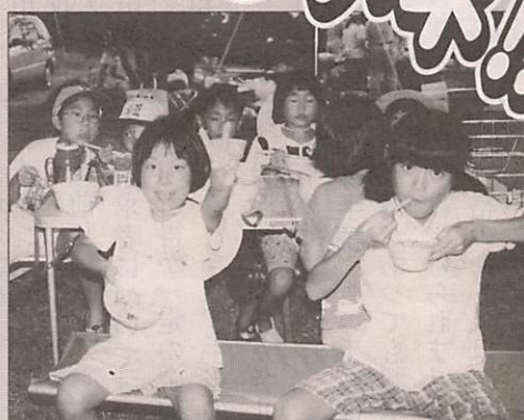
▲こんなに上手にできたヨ!