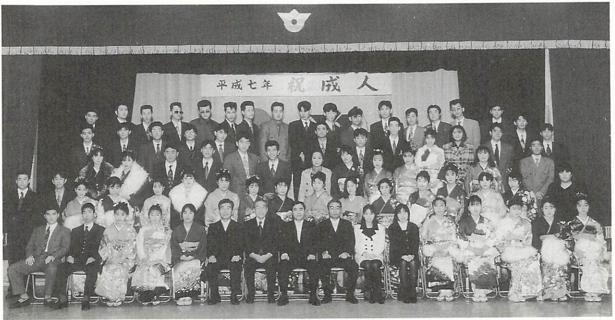
和服姿がめだつ新成人記念撮影

新しく成人の仲間入りをした者達のために、盛大な式典を催して頂き有難うございました。ご激励の言葉を胸に、社会のために貢献できる人間になりたいと決意を新たにしました所です。二十一世紀に向かって、日本も世界の人と手を携えて諸々の問題に対処して行かなければならない。そうした担い手として活躍できるように日々勉学に励み努力していきたいと思えます。(要約)