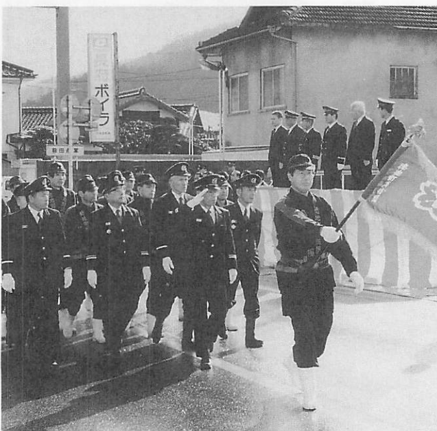
役場前での観閲式