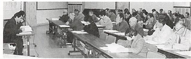
1月30日自治会長研修会で、熱心に研修される自治会長さん

《県回答》 下串・遠内間はH10年度より実施する。又、島地境の峠の現道は掘り下げるので交通止め（バスは除く）を行いますのでご協力をお願いします。上角・鹿野間は努力はするが新規箇所であり近々の着工は困難である。