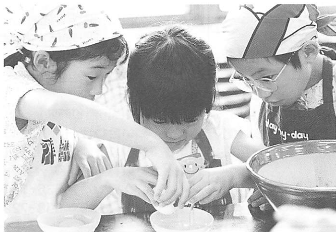
「黄身を壊さないように・・・」心配そう！