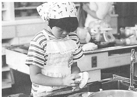
きれいになったかな？ 食事のあとはお片付けです。