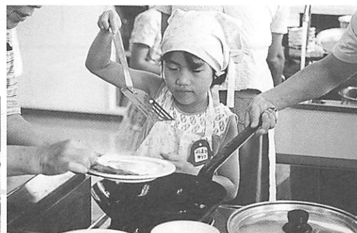
ハムエッグが上手にできました。 盛り付けもきれいにね！

7月22日、保健センターで出雲地区母親クラブを対象に「こどもがつくる簡単朝ごはん」の調理実習があり、こどもたちが挑戦しました。