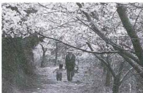
●写真 桜が満開の草山公園