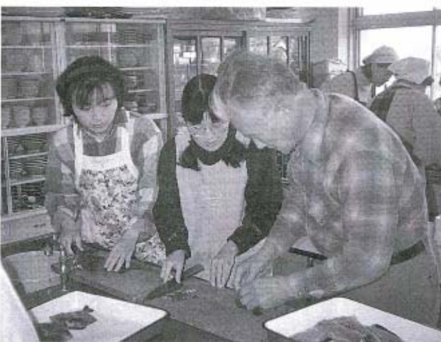
●魚のさばき方や料理のコツなどをマスターしました

3月16日(土)、中央公民館で、「ヤング&ミセスのおさかな料理講習会」が開催されました。おおむね20〜40歳の女性を対象に、秋穂地区魚食普及推進協議会の主催で開かれたこの講習会では、20人の参加者が和気あいあいのうちに、魚のさばき方や料理のコツなどをマスターしていきました。この日のメニューは、メバルの煮付け、イワシのなますと