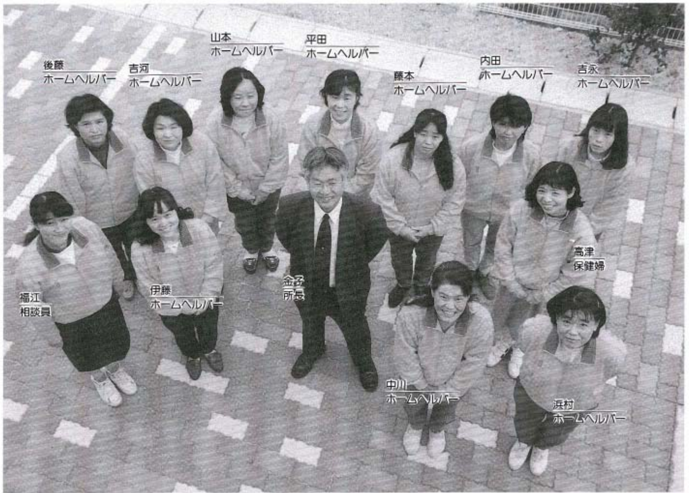
●私たちが在宅介護支援センターのスタッフです。