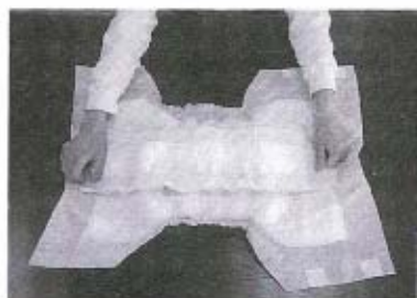
●ひらくタイプと尿とりパット

問 80歳の母が風邪がもとで寝込んでしまいました。私も主人も勤めているので昼間の世話ができません。なるべくなら自宅で見てあげたいのですが、何かよい方法はないでしょうか？(55歳女性)