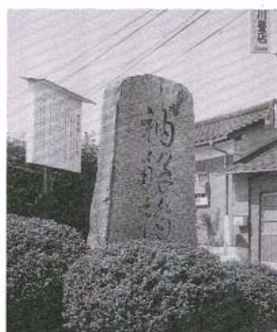
●山口市泉都町にある「袖解（そととき）橋」の記念碑。旅人はここで旅装を整えたと伝えられています。