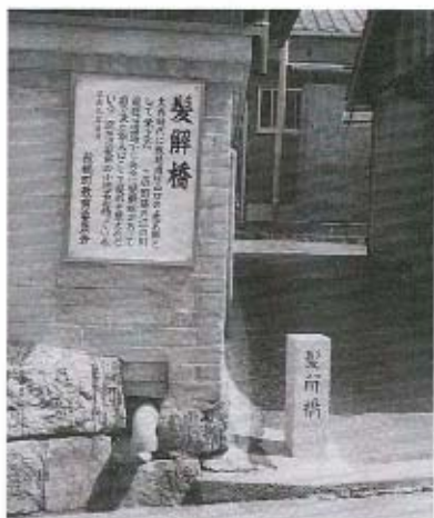
●本町にある「髪解（かみとき）橋」の記念碑。旅人が川の流れに姿を映し髪を整えたと伝えられます。