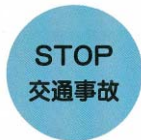
交通安全に関する指導員さんの紹介

4月1日より、地域の交通安全のために活躍されているかたと、そのおもな活動内容を紹介します。(敬称略)