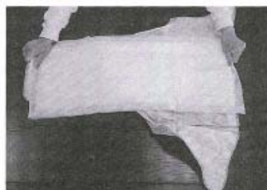
●オムツカバーを使用するタイプ