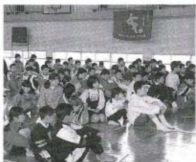
スポーツ少年団に入団した子どもたち。みんな期待に目を輝かせていました。

今年もおおぜいの子どもたちが入団しましたが、それぞれのスポーツを通じて、心と身体を鍛えるとともに、地域の交流の場として役立ててもらいたいものです。