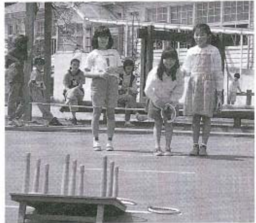
●よく狙いをさだめて