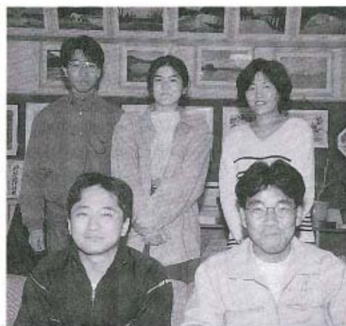
●ふるさと秋穂の一層の活性化を図るため、いっしょにがんばってみませんか?

秋穂町青年団では、ただいま団員を募集しています。現在は、サマーフェスティバルなどの町の行事の参加や町内のカーブミラーの清掃などのボランティア活動を中心にがんばっています。 秋穂町に在住している20前後のかた、難しく考えることはありません。ふるさとのため、自分のためいっしょにがんばりましょう。 詳しいお問い合わせは中央公民館までお願いします。