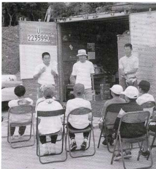
●真剣な表情で、説明を受ける子どもたち

今年も中道海岸で、小学5・6年生を対象にしたヨット教室が、7月7日・14日・21日の3回シリーズで開催されました。秋穂町ヨット連盟の皆さんの丁寧な指導のおかげで、参加者は、第1日目から自走できるほどの上達ぶりでした。自然のなかで、真っ黒に日焼けしがんばった子どもたちの顔は、見違えるほどたくましくなっていました。