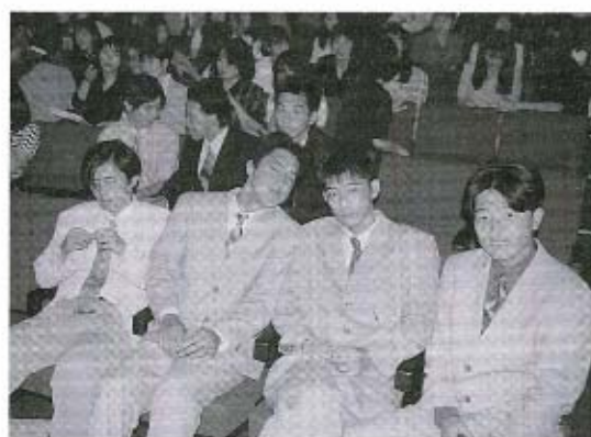
○りっぱになったでしょ