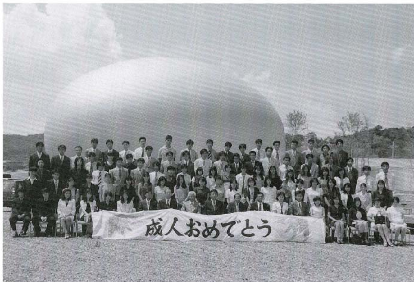
○らんらんドームの前で20歳の記念撮影