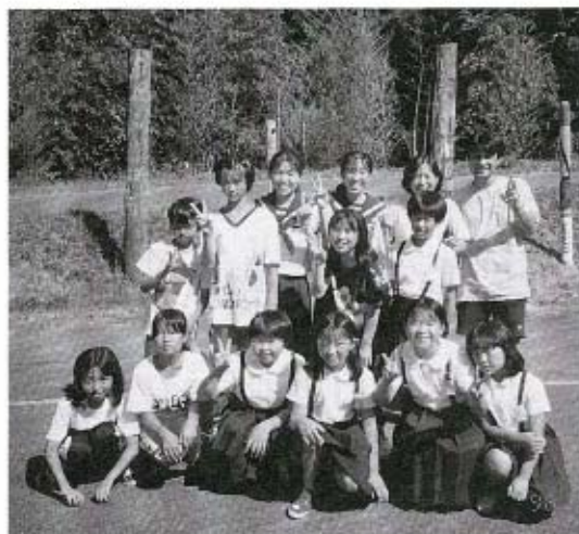
●2泊3日の研修でいろいろなことを学びました