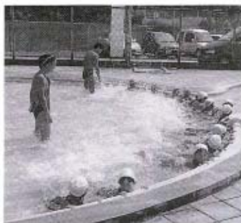
●ただいま練習中です