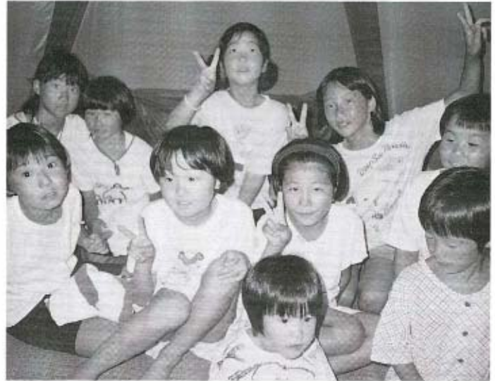
テントのなかでピース。昼間の疲れも忘れ夜遅くまで楽しそうな笑い声が聞こえてきました。

今年の夏一番の思い出になりました 7月27日と28日にコミュニティセンターでにこにこキャンプ