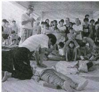
○もしもに備えての救急法

自然を身近かに感じた3日間 小さな町と大きな町の交流 自然の豊かさに恵まれた町の 子どもと、物質文化のもろさを 身をもって体験した神戸市内の 子どもたちの交流を目的とした 「小さな町と大きな町の交流」 が7月23日(火)から25日(木)