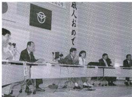
○テーブルトークの様子

177人が 大人への出発 （卒業生） 成人式 8月15日（木）、大海総合センターを会場に夏の成人式が行われました。 今年、男子58人・女子59人の成人のうち、84人が式典に参加。会場は久しぶりに顔を合わせた友人との再会を喜ぶ笑顔であふれていました。