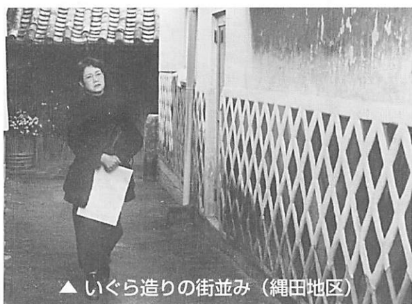
▲ いぐら造りの街並み (縄田地区)

阿知須の歴史を語る私たちの仲間・居蔵屋も最近では少なくなりました。残念ですが仕方ないですかね。でも今も残る居蔵屋はすごいですよ。家の基礎の石、今ではとても手に入りませんよ。さすが千石船の阿知須浦です。そして大壁に漆喰で描いた模様も、栄えた阿知須浦を今に語りかけていますよ。