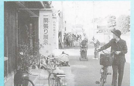
▲旧野村酒場(寺河内)で 思わず立ち止まり…