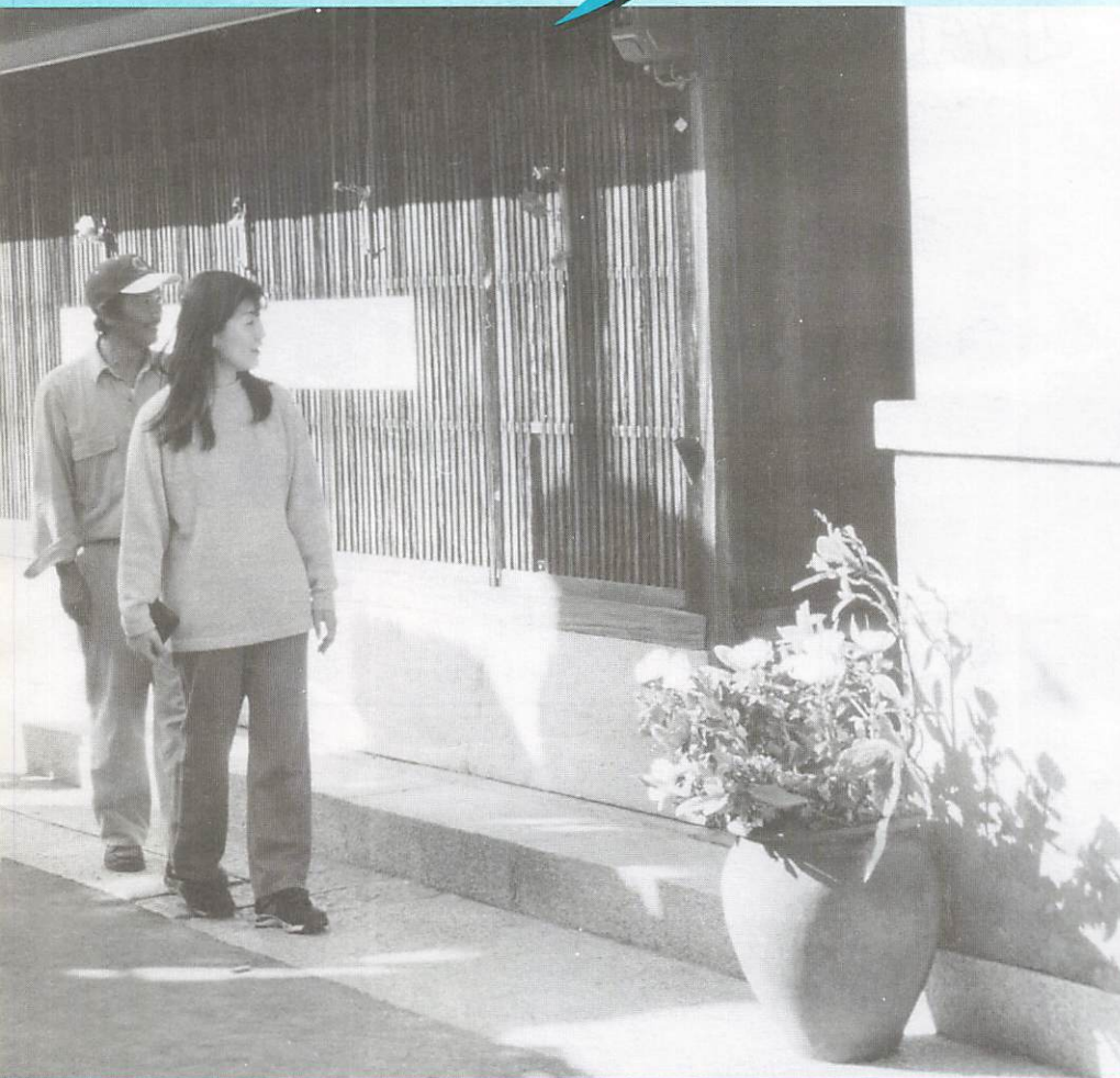
▲中川邸(縄田北区)の玄関から和紙人形を覗いてビックリ