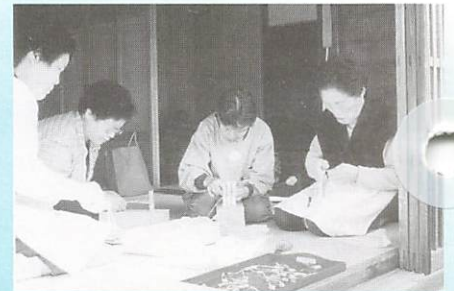
▲福ぞうりを真剣に編む婦人会のみなさん