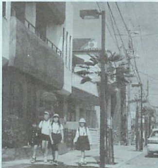
▶ 歩道も並木も一新駅通り

■問い合わせ 町建設課都市計画係 (Tel 65-4111 1 (内)235 (有)2123)