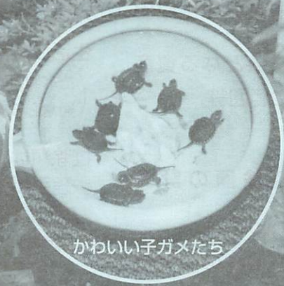
かわいい子ガメたち