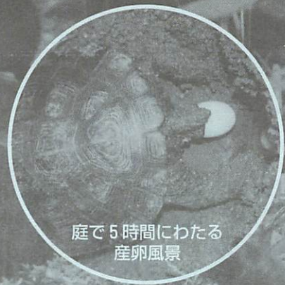
庭で5時間にわたる 産卵風景