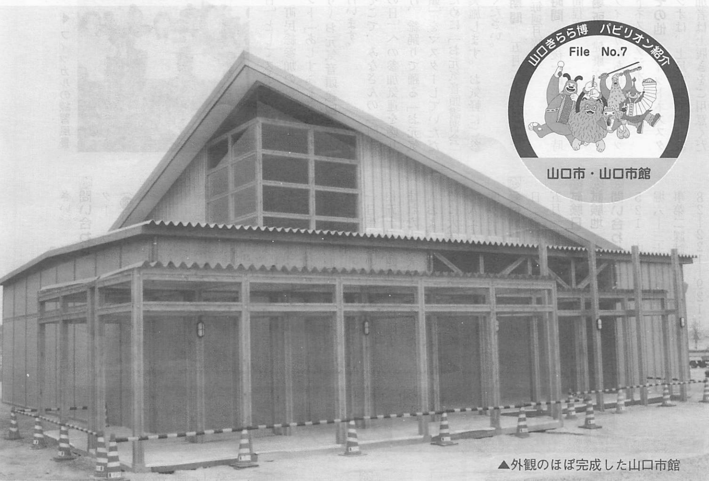
▲外観のほぼ完成した山口市館