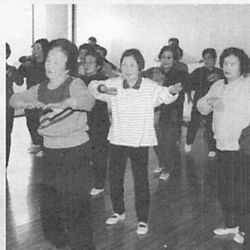
◀ フィットカルの練習風景

の日」としてスポーツゾーンで、町民総参加のシンボルイベント「あじすふるさと夏まつり」お元気音頭総踊り」を行います。