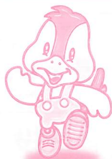
阿知須町イメージキャラクター 「ココロちゃん」

発行：阿知須町役場 〒754-1292 山口県吉敷郡阿知須町 TEL.0836-65-4111 http://ajisu.com