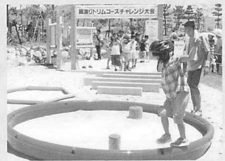
▲綱渡りチャレンジ大会に挑戦？