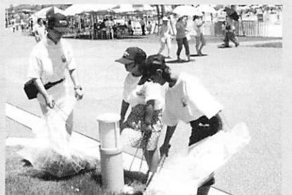
▲きらら博の精神に基づきボランティアも活躍