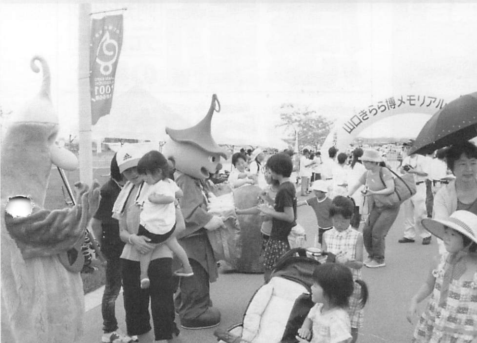
▲開場と同時に入場する人々をきららバンドがお出迎え