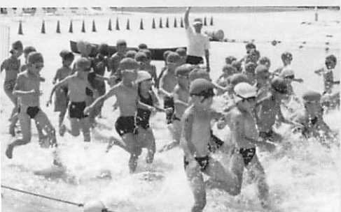
▲みんながんばったキッズトライアスロン