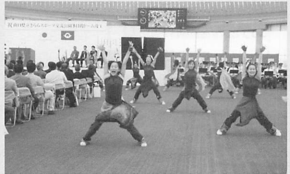
▲竣工式でぶちきらめき隊が登場し会場を盛り上げました

会場は「きらら博の感動、再び！」とばかりに多くのイベントが開かれ、暑さを吹き飛ばすみんなの元気とパワーが会場を盛りあげました。