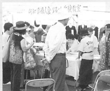
▲いきいき・エコパークで婦人会も出店