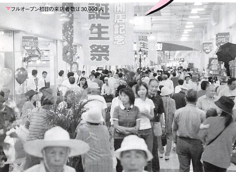
▼フルオープン初日の来店者数は30,000人