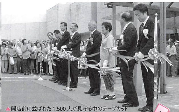
▲開店前に並ばれた1,500人が見守る中のテープカット