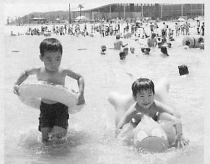
▲月の海も海水浴客でいっぱい