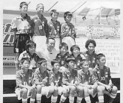
▲憧れの松木安太郎さんとハイ・ポーズ!