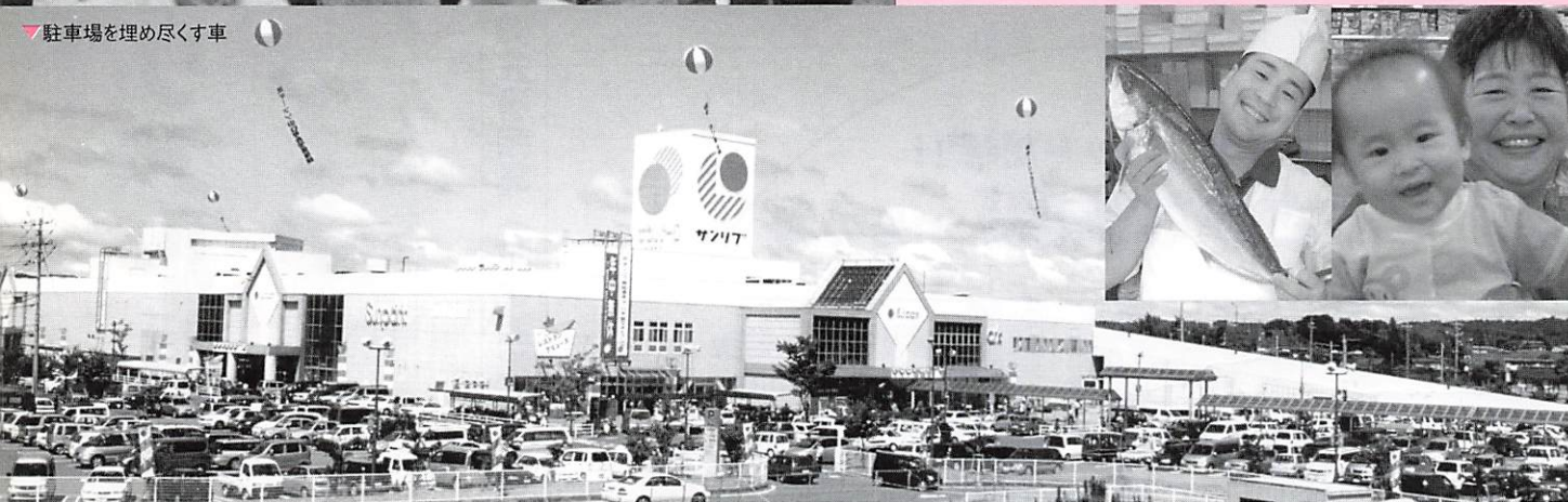
▼駐車場を埋め尽くす車