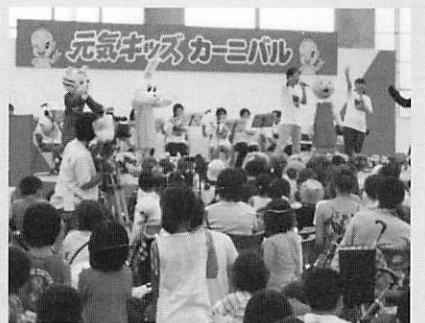
▲元気キッズカーニバルには多くの親子連れが