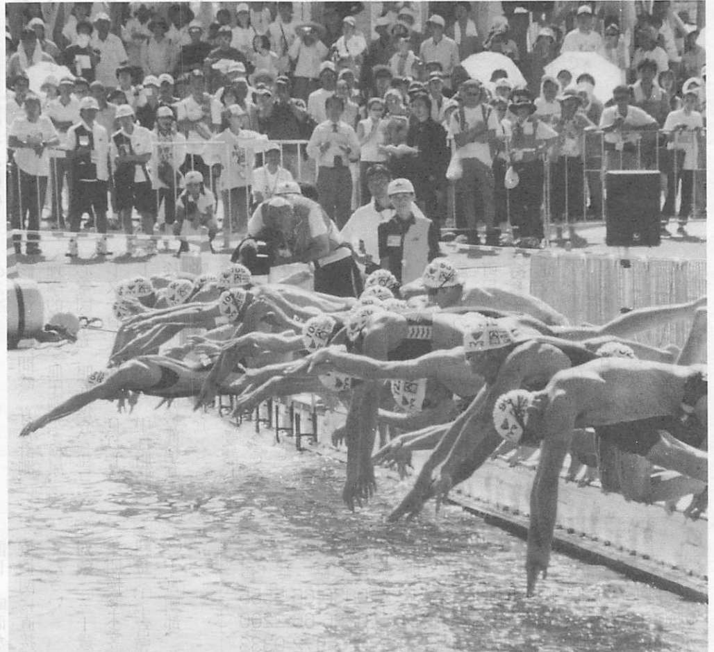
▲号砲に合わせて月の海に一齐に飛び込む選手