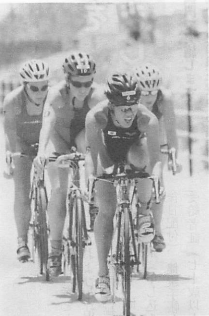
▲星の丘付近を集団で走行する選手