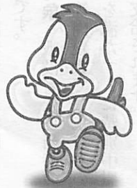
阿知須町イメージキャラクター「コッコちゃん」