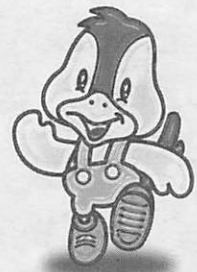
阿知須町イメージキャラクター 「コッコちゃん」