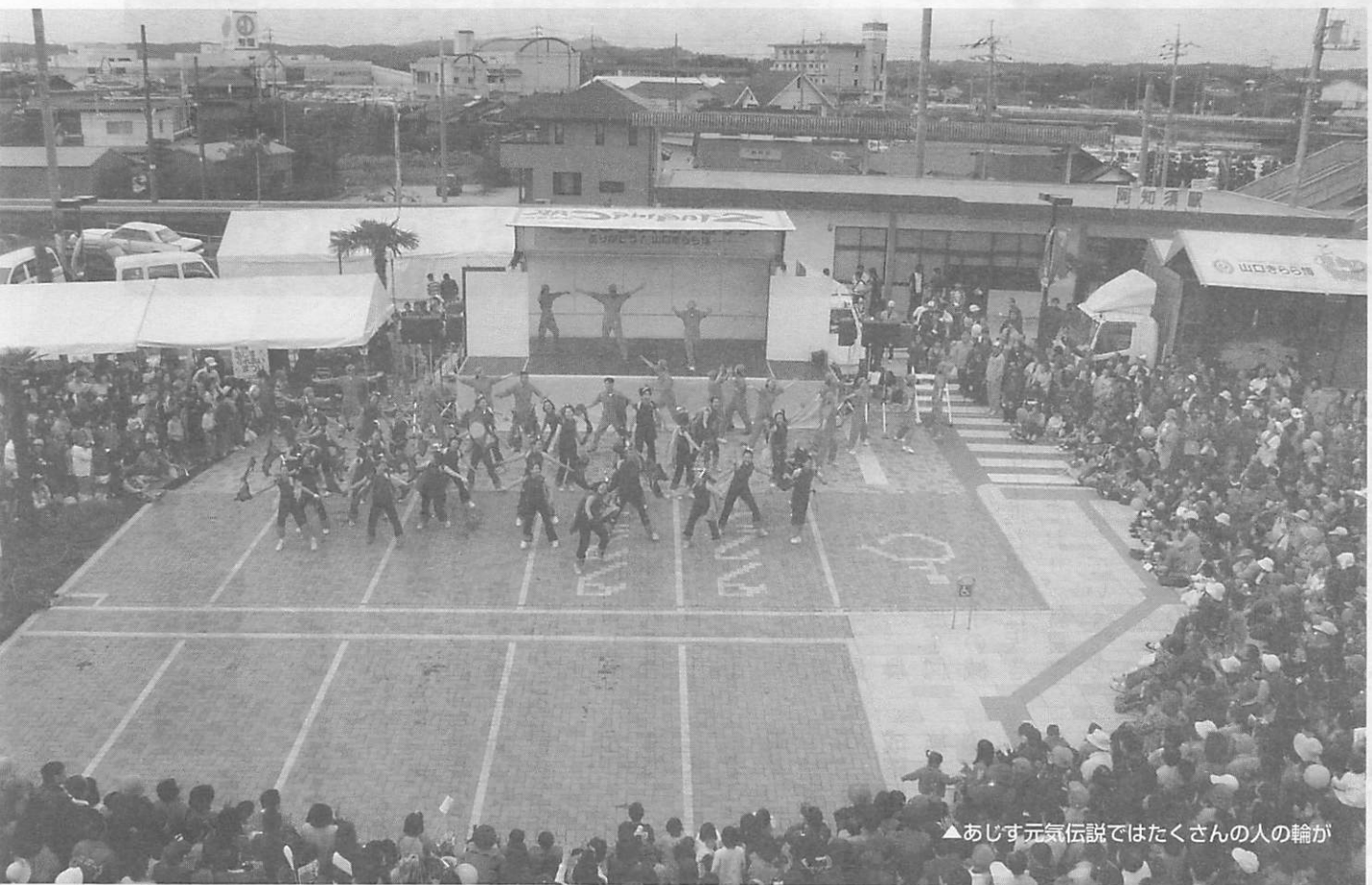
▲あじす元気伝説ではたくさんの人の輪が