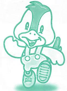
阿知須町イメージキャラクター 「コッコちゃん」

発行：阿知須町役場 〒754-1292 山口県吉敷郡阿知須町 TEL.0836-65-4111 http://ajisu.com