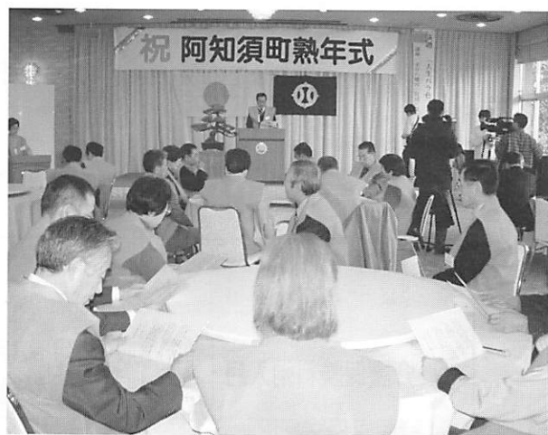
▲揃いの赤いちゃんちゃんこを着て式に出席