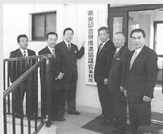
▶事務局に看板をかける 各首長

15.1.6 県央部の任意合併協議会である 県央部合併推進協議会発足 事業計画、事務局規定、専門部会要領、運 営の申し合わせ 事項、傍聴要領 を承認。この席で、 町長が「次回の 協議会で、合併の 枠組みを最終的 に表明したい」と 発表。また、山口 市に事務局を開設。 本町からも職員一 人を派遣。