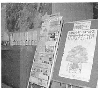
▲県央部や宇部小野田地域任意合 併協議会の議事録も閲覧できます。

めまぐるしく動き始めた合 併協議。町役場玄関ロビーに 合併情報コーナーを設置して いますので、どうぞご利用く ださい。