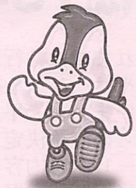
阿知須町イメージキャラクター 「コッコちゃん」