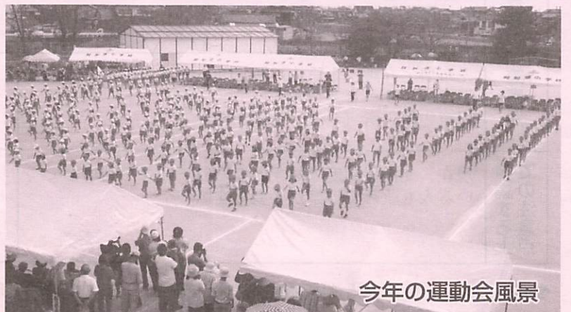
今年の運動会風景

なお、当時の阿小児童数は816人（男子386人、女子430人）、今年度児童数は365人（男子207人、女子158人）です。