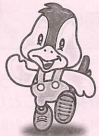
阿知須町イメージキャラクター 「コッコちゃん」