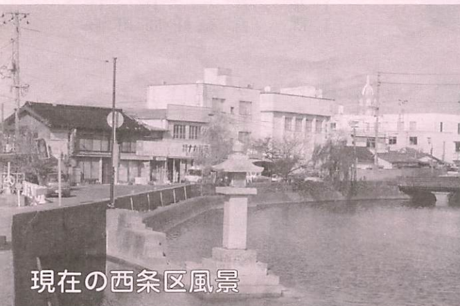
現在の西条区風景