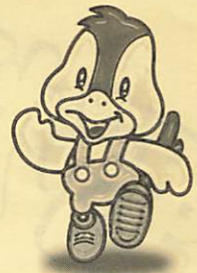
阿知須町イメージキャラクター 「ココロちゃん」