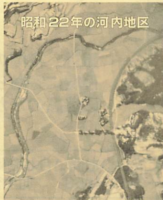
昭和22年の河内地区